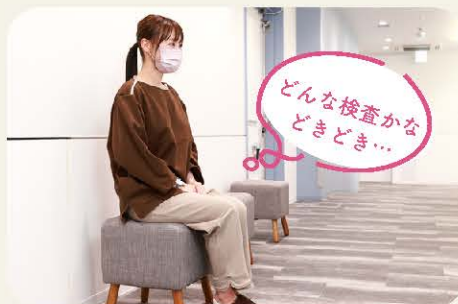
scene2 検査着にお着替え