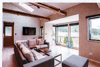
【露天風呂付コテージ】 プレミアムヴィラ

ワンランク上のプレミアムコテージで 森と星に囲まれた贅沢な空間をお楽しみください。